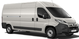
Grigio Expedition (676) (erikoispastelliväri)