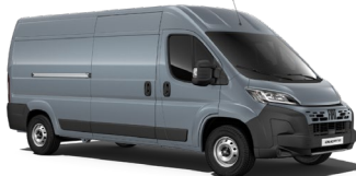
Grigio Ferro (691) (metalliväri)